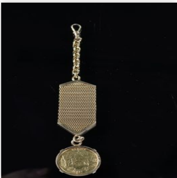
23 Pièce or 20frs Roi Albert 1914 et monture en or (24.06gr)