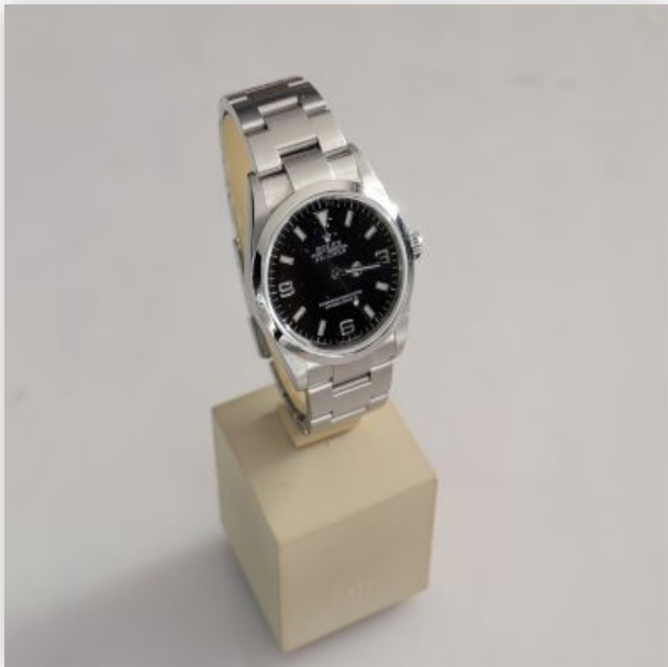
27 Rolex Explorer jamais portée Cadran Noir 2003 Boite et papier d'origine...