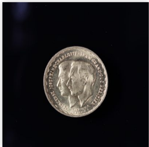
16 Piece Or 20 Francs 1953 à l'effigie du Grand Duc Jean et de la Princesse...