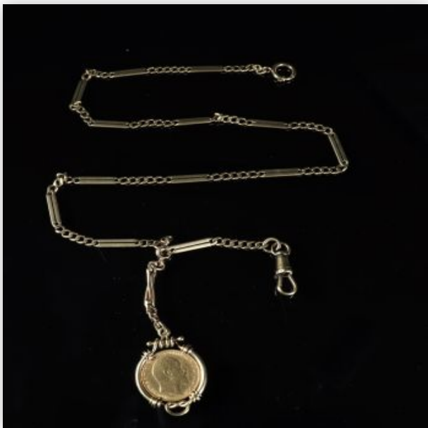
21 Pièce Souverain Or Edouard VII montée sur chaîne or (34.50gr)