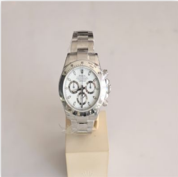
31 Rolex Daytona Acier jamais portée Cadran Blanche Chromalight 2016 Boite...