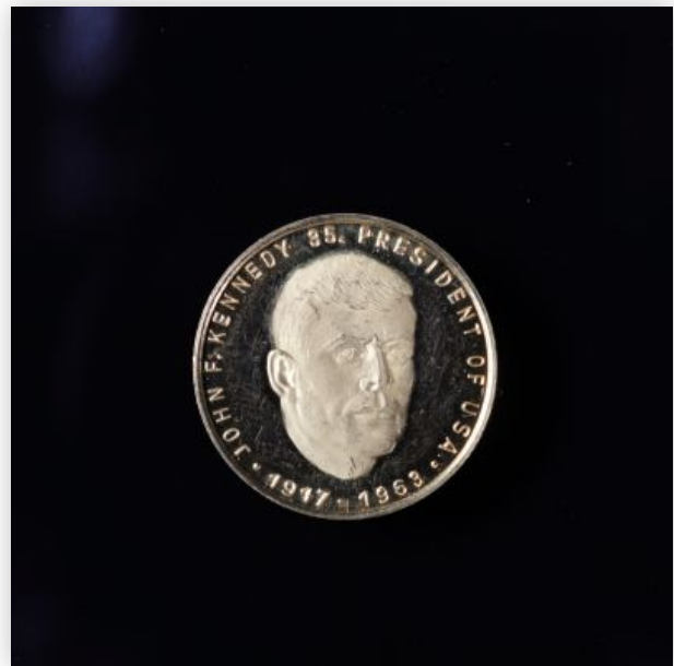
14 1 Pond en or d'Afrique du Sud - 1892