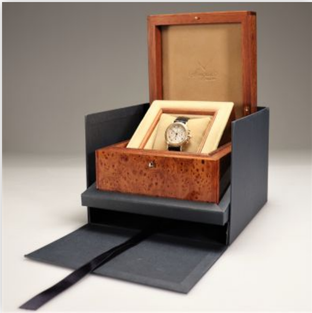
25 Montre Breguet Marina chronographe en or et diamants