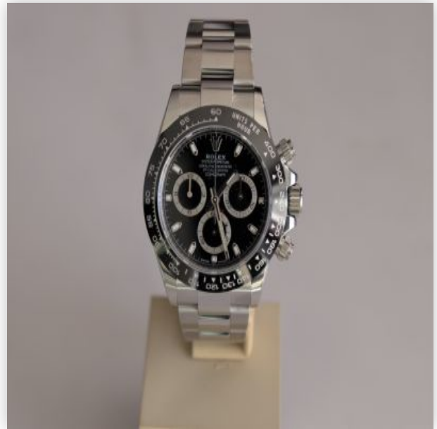
30 Rolex Daytona Acier jamais portée Cadran Noir 2020 Boite et papier d'origine...