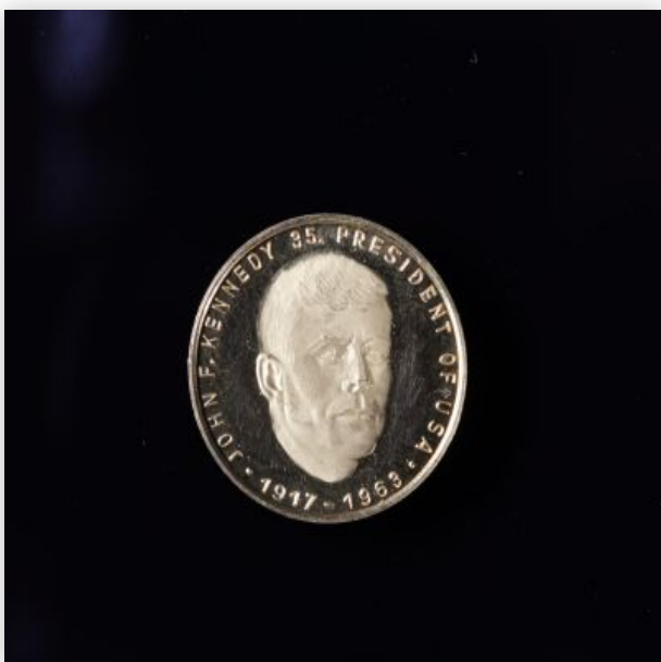
15 Pièce or J.F. Kennedy (1917-1963)