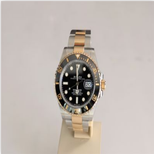
29 Rolex Submariner Or Acier Cadran Noir 2021 Boite et papier d'origine 126613