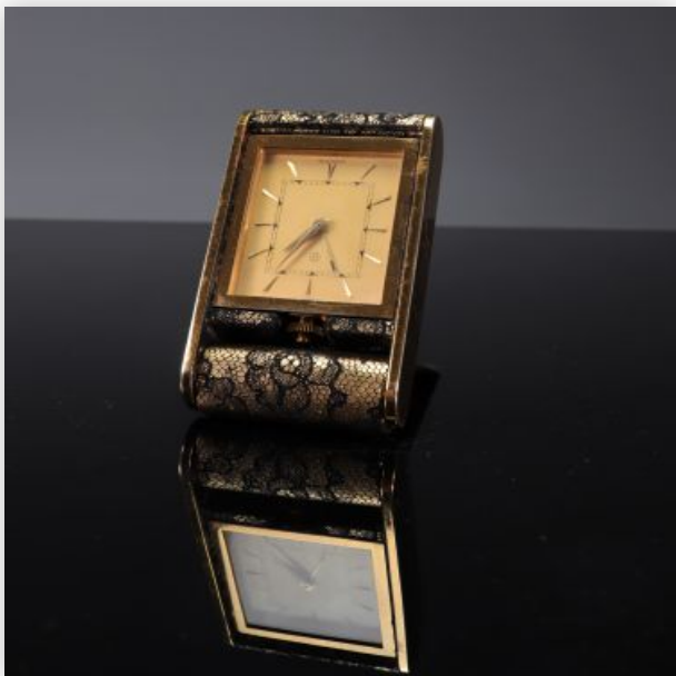
5 Jaeger-LeCoultre pendulette de voyage