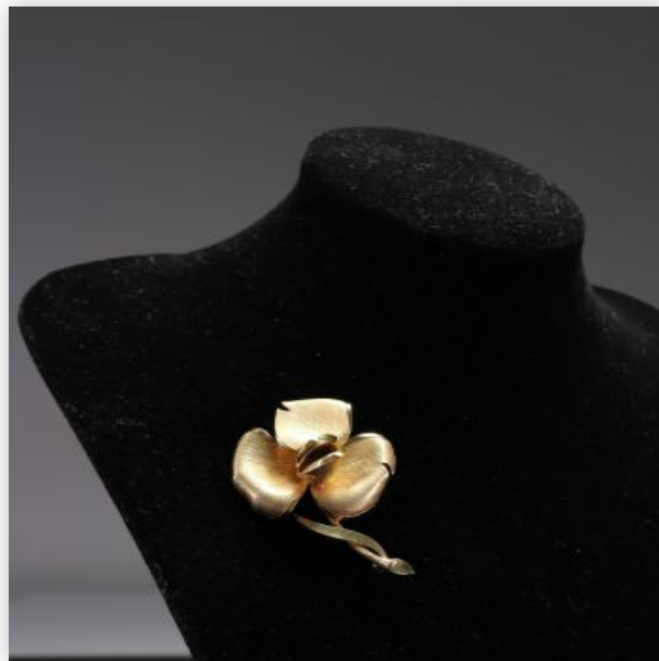
6 Broche montre Suisse secrète signée