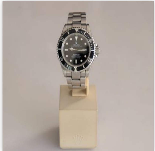
28 Rolex Sea Dweller Cadran Noir 1996 Boite et papier d'origine 16600