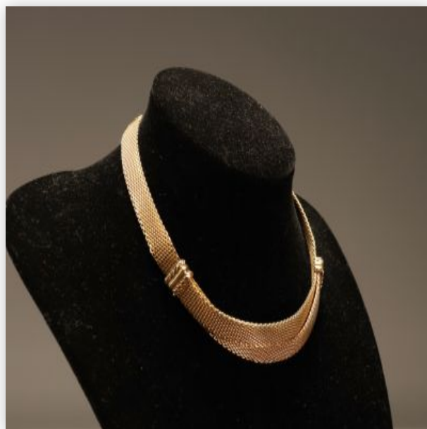
8 Christian Dior collier plaqué or