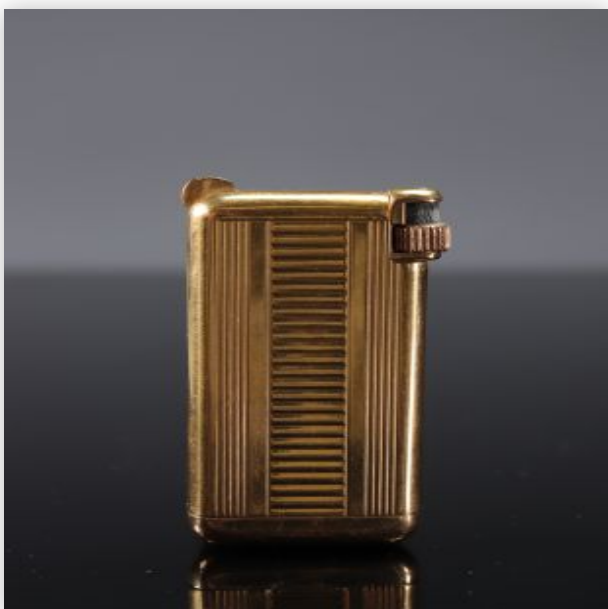
7 Briquet flaminaire Art Déco