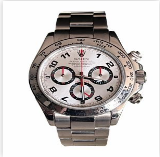
26 Rolex Daytona Or Blanc Cadran Gris 2007 Boite et papier d'origine 116509