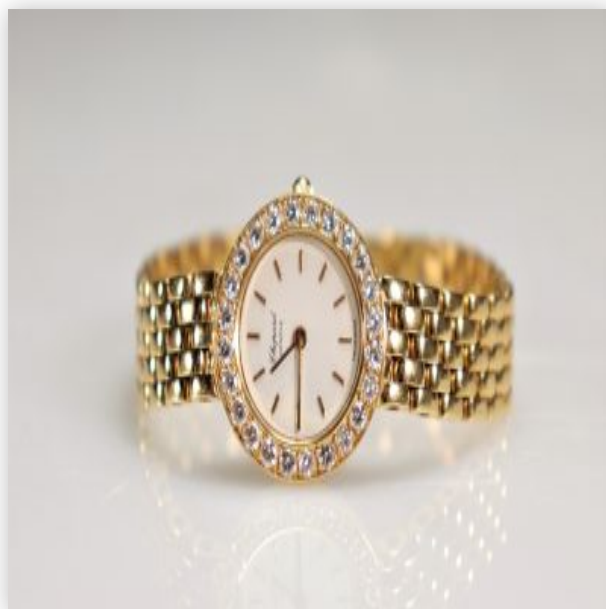
24 Montre Chopard or (18k) et diamants