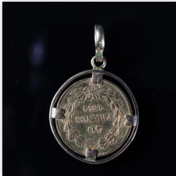
22 Pièce 40 Francs Or Louis-Philippe Ier et monture or (17.39gr)